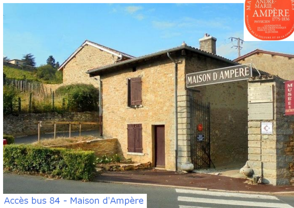
Accès bus 84 - Maison d'Ampère

300 route d'Ampère, 69250 Poleymieux-au-Mont-d'Or, Métropole de Lyon, Auvergne-Rhône-Alpes